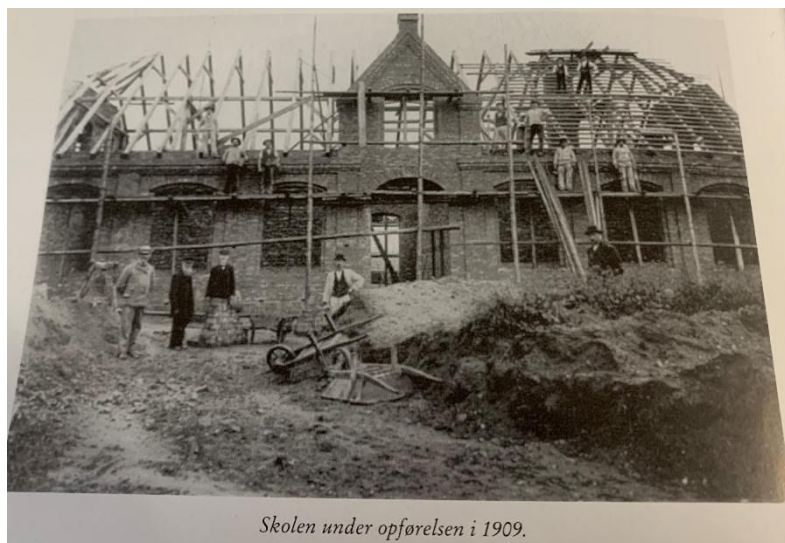
Skolen under opførelsen i 1909.