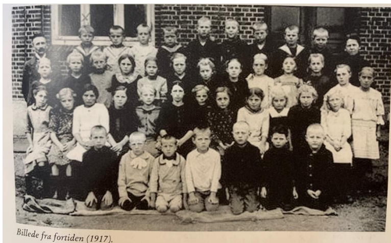
(Dengang i og omkring Gram – strejftog i fortiden side 211)

Samarbejdet mellem skole og hjem blev sat i rammer, så både forældre og elever vidste, hvornår skolen indbød til møder og sammenkomster. (Dengang i og omkring Gram – strejftog i fortiden side 204)